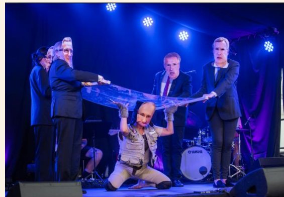
Voksne Talenter vant prisen i temakonkurransen «Humor mot diktatoren»