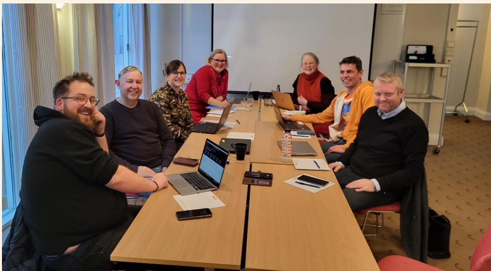
Styremøte november 2023